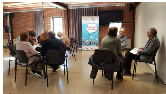
Grup groc: petits grups de treball