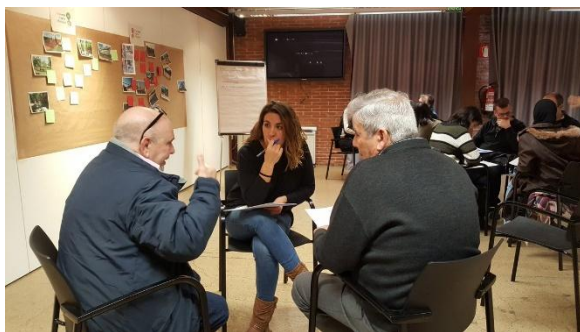
Grup verd: petits grups de treball

Finalment, cada grup (groc i verd) es va subdividir en petits grups de treball de 3 o 4 persones per treballar conjuntament per a finalment presentar propostes que es penjaran a la plataforma: